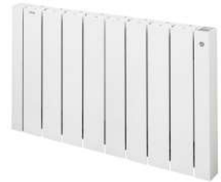
Acova Volga Plus